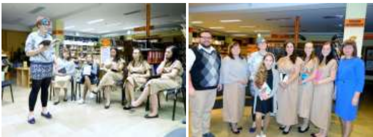
Lasītāju kluba 4.sezonas 1.tikšanās, 26.09.2017.