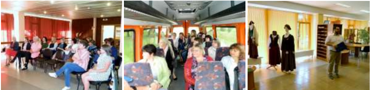
Druvas vidusskolas skolotāju vizīte bibliotēkā, 06.10.2017.