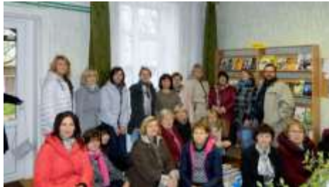
Saldus un Brocēnu novadu bibliotekāru Ziemassvētku seminārs, 27.12.2017.