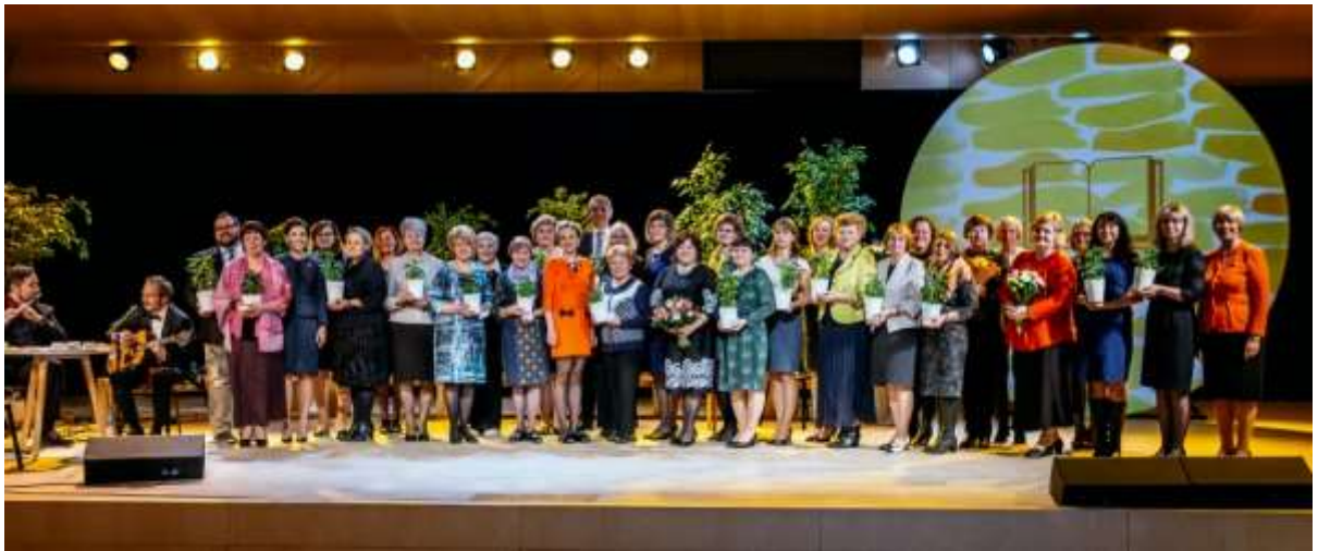
Apbalvojuma “Laiks Ziedonim” cildināšanas ceremonija Latgales vēstniecībā “GORS” Rēzeknē, 03.05.2017.