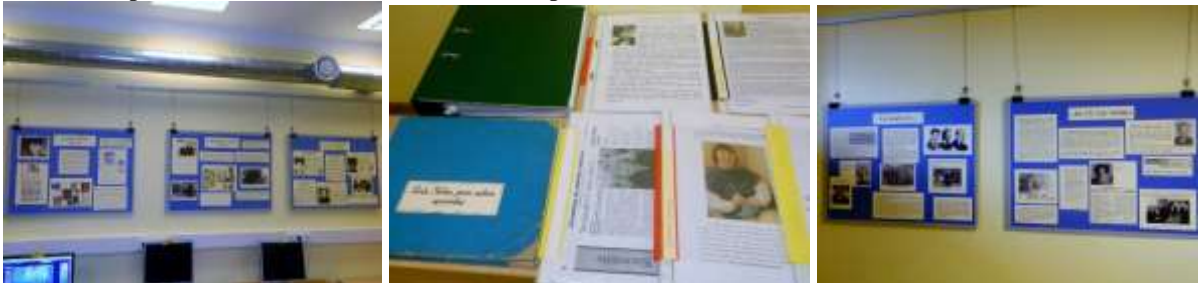
J.Rozentāla Saldus vēstures un mākslas muzeja izstāde "Saldus Sv. Jāņa baznīca", 05.04.-30.04.2017. / Kolekcijas izstāde "Par piemiņu no izrādes", 20.03.-30.04.2017.