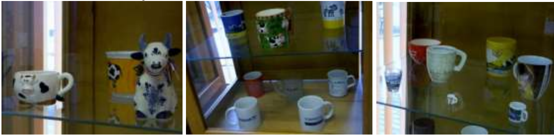
SPB novadpētniecības izstāde "Saldus literārā apvienība", 02.03.-31.03.2017.