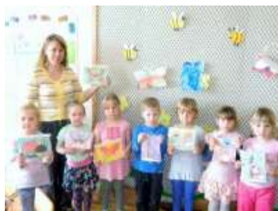
„Pužļu likšanas čempionāts”, 12.06.-30.06.2017.