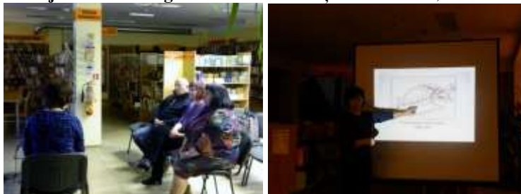
Grāmatu andele Kursīšos, 17.02.2017.