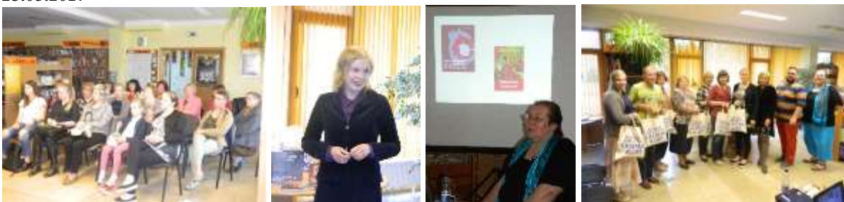
Krustvārdu mīklu risināšanas čempionāta 3.posma 9.kārta un noslēgums, 26.05.2017.