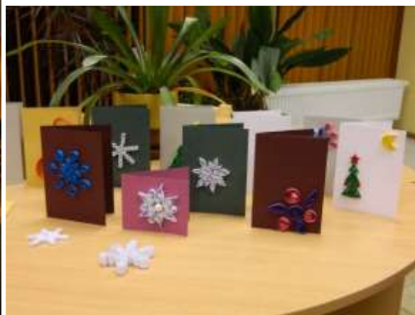
Rūķu darbnīca – apsveikuma kartiņu gatavošana