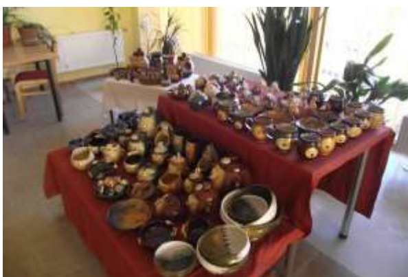
Pampāļu keramikas izstāde