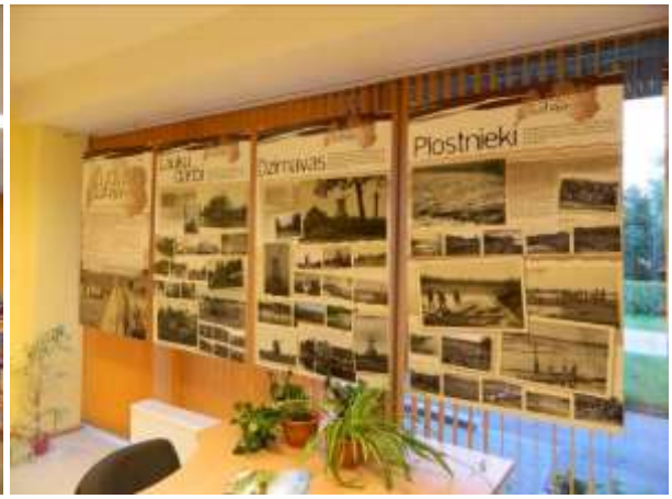
LNB ceļojošā izstāde „Zudusī darbīgā Latvija” bibliotēkā