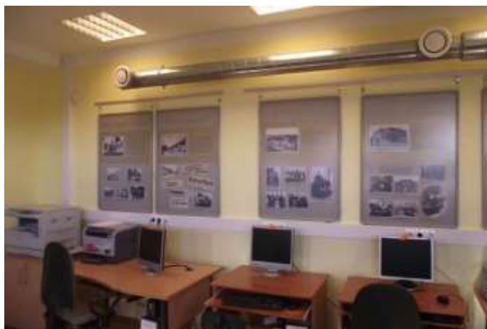
J.Rozentāla Saldus vēstures un mākslas muzeja izstāde „Lielā iela”