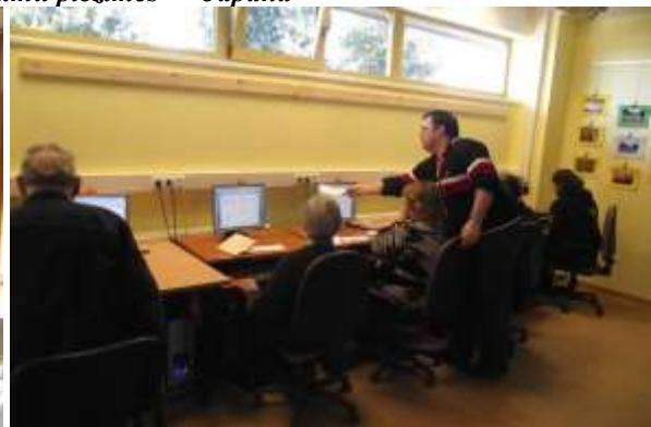
Datorlietošanas apmācības bibliotēkā