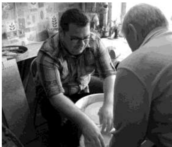
Saldus un Brocēnu novadu bibliotekāru izbraukuma seminārā Pampāļos