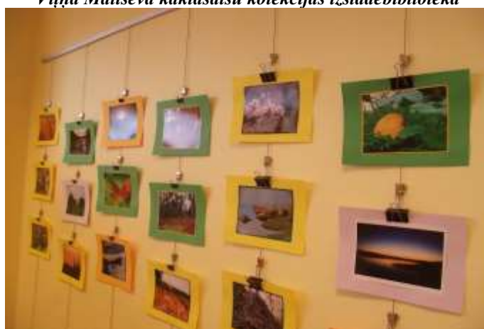
Mareka Našenieka fotogrāfiju izstāde