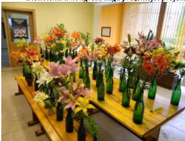
Liliju izstāde bibliotēkā