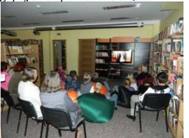
TV3 seriāla „Ugunsgrēks” 6.sezonas atklāšanas sērijas demonstrējums bibliotēkā, sadarbojoties ar kultūras darba organizatori