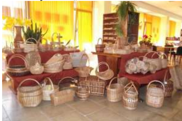
Pinumu izstāde no Zaņas pagasta