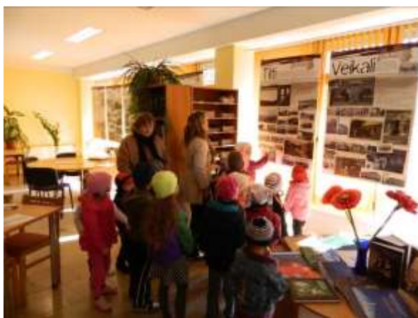
Bērnudārza bērni apmeklē bibliotēkā notiekošās izstādes