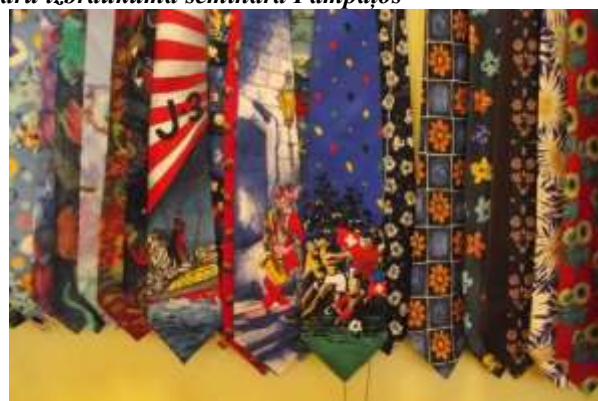
Viļņa Mališeva kaklasaišu kolekcijas izstādebibliotēkā