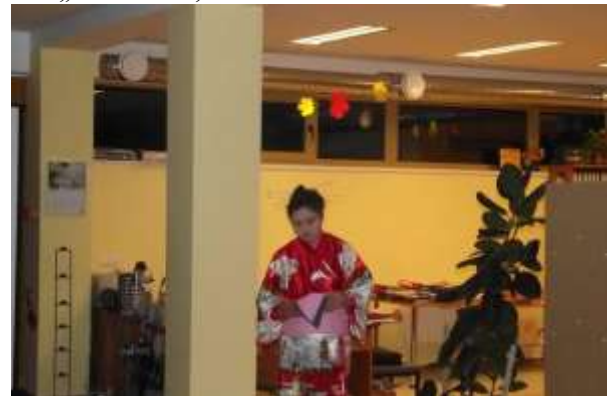
Pasākumu cikls „Ceļojumu piezīmes” – Japāna