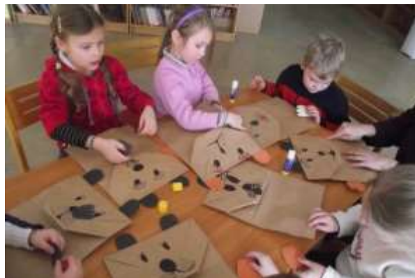
Pasākumu cikls bērniem „Stāsti par...”