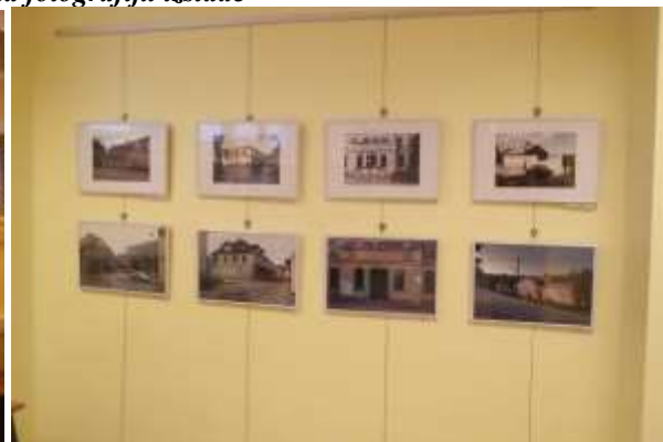
Fotoizstāde – „Saldus dabas kultūrvides attēls”