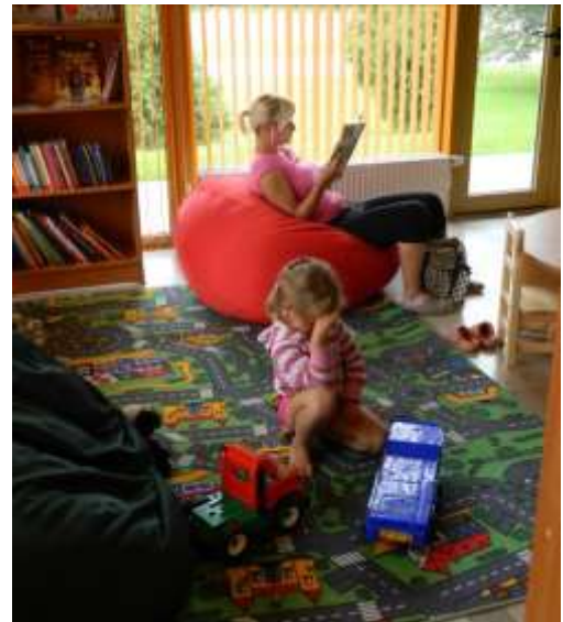
Bērnu zonu izmanto vecāki un bērni