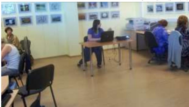
Apmācības „Filmēšana un video materiālu apstrāde” projekta „3i” ietvaros