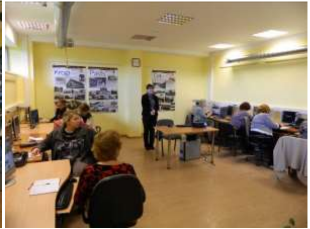
Izglītojošs seminārs Kursīšu pamatskolas skolotājiem sadarbībā ar LNB