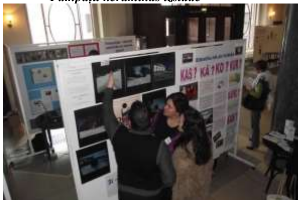
Bibliotekāru kongresā Rīgā prezentējot projektu „3i” un stāstot par apmācību programmu ASV