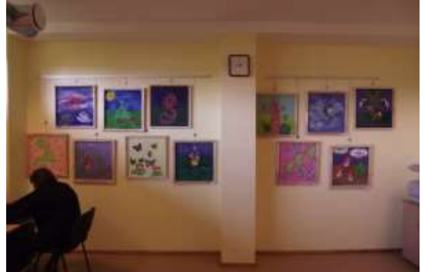
Kursīšu pamatskolas mājturības un tehnoloģiju programmā tapušo skolēnu darbu izstāde